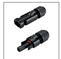
Standard4 connectors / Standard4 Verbinder